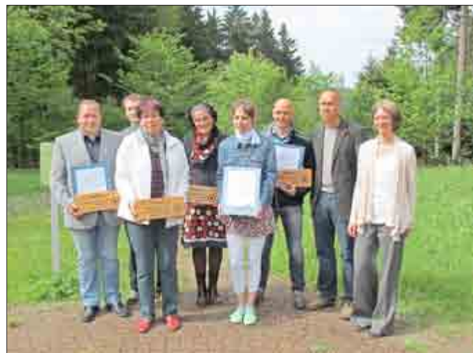
Die ersten fünf Biosphärenreservats-Partner